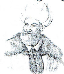
خير الدين بربروس

التعليمية 1: أرادت كل شخصية بأعمالها خير الدين بربروس * قاد حملة لا فتكاك تونس من العثمانيين سنان باشا * حاصر تونس من الإسبان شاركان * دخل إلى تونس من الجزائر وقضى على الحكم الحموي